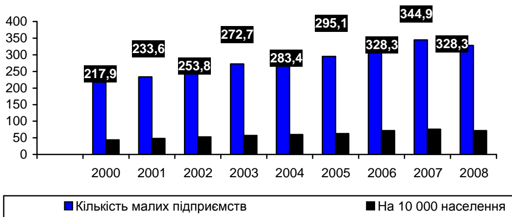
Рис. 3. Кількість малих підприємств в Україні в період з 2000 по 2008 рр. (тис.) [8]

У більшості країн з перехідною економікою зайва зарегульованість підприємництва та інші несприятливі фактори загальмували розвиток малого бізнесу, не дозволили новою мірою використовувати його потенціал для прискорення економічного зростання і боротьби з безробіттям. Найбільш активні верстви населення змогли реалізувати себе і в умовах жорсткої зарегульованості, а широкої соціальної бази малий бізнес так і не отримав. Кількісну сторону процесу розвитку сектора малого бізнесу в Україні представляє рис. 3.