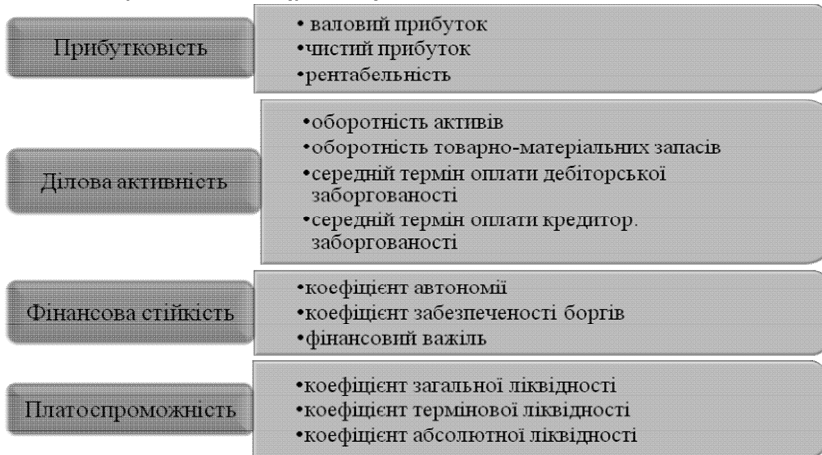
Рис. 1. Групи розрахункових показників для оцінки фінансово-економічного стану підприємства

Оцінку фінансово-економічного стану підприємства можна здійснювати за допомогою основних показників прибутковості, ділової активності, фінансової стійкості, платоспроможності (рис. 1):