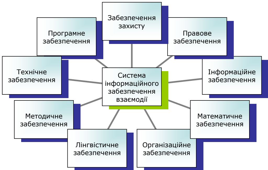
Рис. 1. Структура системи інформаційного забезпечення взаємодії підприємств-партнерів

Слід зазначити, що властивості інформаційних систем безпосередньо пов'язані із їхньою структурою, яка є досить розгалуженою, що ілюструє рис. 1.