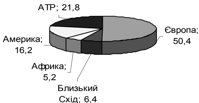
Рис. 1. Питома вага туристичних регіонів світу у просторовій структурі міжнародного потоку, 2010 р., %

Головним туристичним регіоном світу залишається Європа, на яку припадає 50,4% від загальносвітового обсягу туристичних прибуттів. На другій позиції із помітним відставанням утримується Азійсько-Тихоокеанський регіон (АТР), на третій – Америка. «Периферійним» туристичним регіоном світу є Африка (рис. 1).