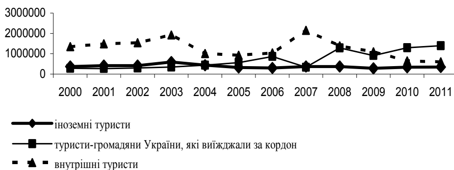
Рис. 1. Динаміка туристичних потоків по Україні

Держкомстату, всього впродовж 2011 року туристичними операторами Полтавської області обслужено 36 тис. туристів (на 7000 ос. менше, ніж у 2010 р.) і 28116 ос. екскурсантів (на 1460 осіб більше, ніж у 2010 р.), в тому числі за видами туризму: в'їзний – 431 особа (на 205 осіб менше, ніж за 2010 рік); виїзний – 15163 особи (на 831 особу менше, ніж за 2010 рік); внутрішній – 20405 осіб (на 6014 осіб менше ніж за 2010 рік) [7]. Динаміка туристичних потоків за останнє десятиліття показує, що на українському ринку переважав внутрішній туризм, виїзний туризм набув значного розповсюдження лише з 2005 року, іноземний туризм стабільно перебуває на рівні близько 40 тис. туристів на рік (рис. 1) [6].