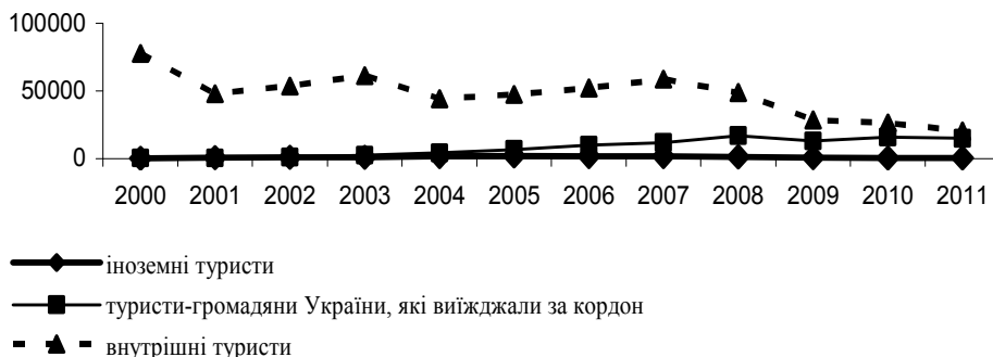
Рис. 2. Динаміка туристичних потоків по Полтавській області

Статистичні дані по Полтавському регіону також показують значну перевагу внутрішнього туризму, досить низьку частку іноземного туризму та стабільне зростання кількості виїзних туристів (рис. 2) [7].