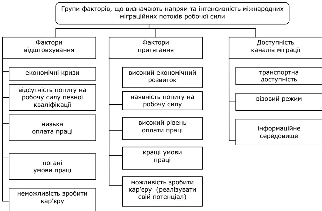
Рис. 2. Основні групи факторів міжнародної трудової міграції*

Зміни в міграційному режимі суттєво можуть впливати на інтенсивність міграційних потоків. Так, наприклад, зміни імміграційного режиму в США в 1965 році зумовили значне підвищення міграційних потоків до цієї країни в зазначений період [1, с. 130].