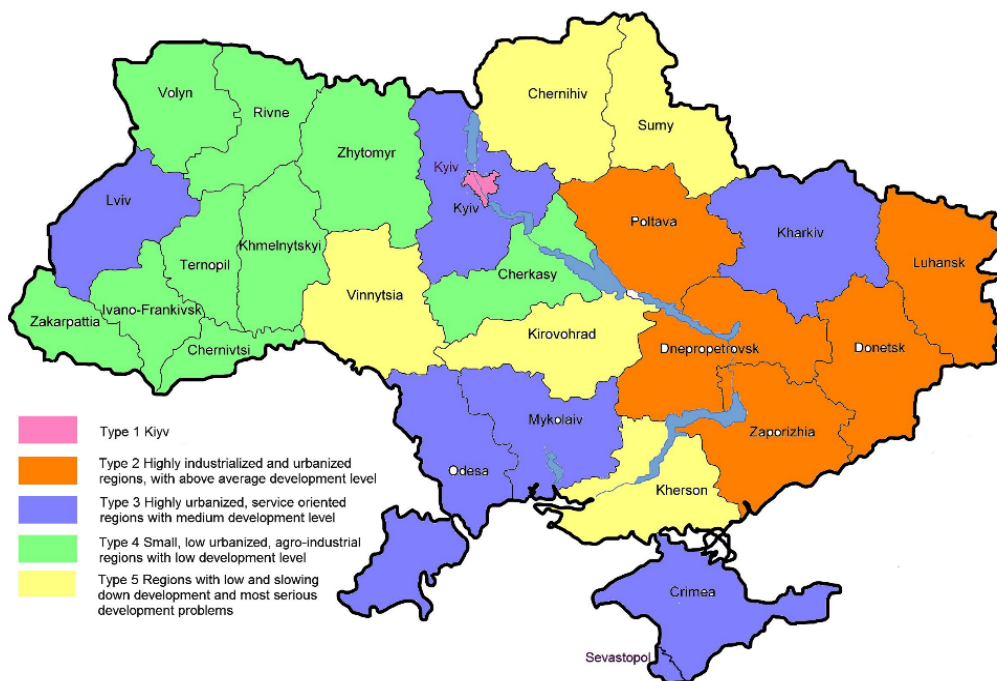
Рис. 1. Типологія регіонів України [1, с. 134]

Різні темпи розвитку регіонів підсилюються кризовими проявами в економіці. Це в основному спричинено дією механізму ринкової конкуренції, що призвело до поділу регіонів за їхніми конкурентними перевагами, різним рівнем адаптації до умов ринку регіонів з різною структурою економіки, можливостями місцевої влади до проведення реформ на регіональному рівні та типологією регіонів (рис. 1) [1, с.134].