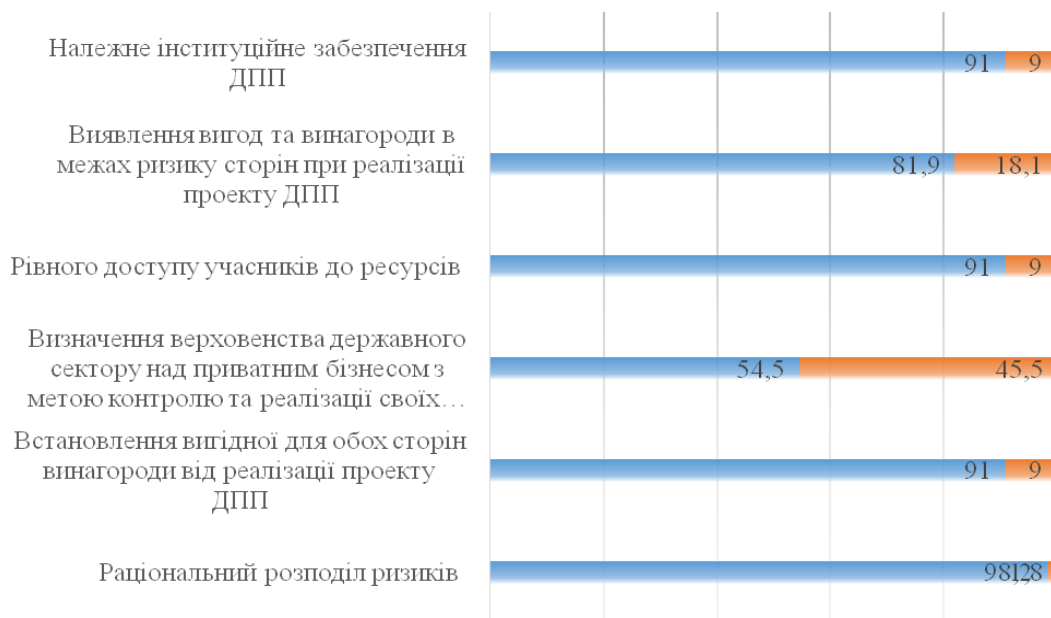
Рис. 2. Умови сприяння розвитку партнерських стосунків між державою, бізнесом та суспільством (у %)*

Проаналізувавши наведені проблеми, за результатами дослідження було визначено та оцінено умови, необхідні для розвитку ДПП на регіональному рівні у соціальній сфері (див. рис. 2). Задані умови стануть напрямками подолання проблем, показаних на рис. 1.