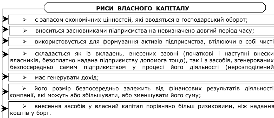
Рис. 1. Характерні ознаки власного капіталу

З економічної сторони капітал є фактором виробництва, ресурсами, що вкладені у виробничий процес; у правовому ракурсі – вартісним вираженням права власності особи на засоби підприємства, окреслює межі відповідальності суб'єкта за свої зобов'язання; обліковий аспект власний капітал розглядає як різницю між активами і зобов'язаннями, джерело утворення майна.