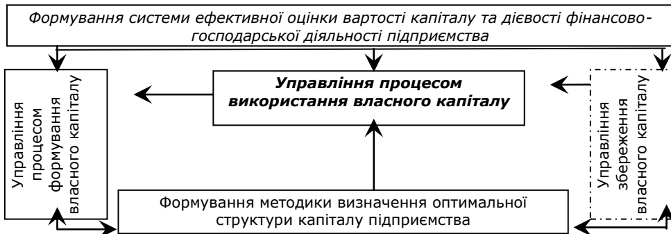
Рис. 3. Модель системи управління власним капіталом на підприємствах споживчої кооперації

Управління власним капіталом на кооперативному підприємстві має враховувати всі стадії руху власних джерел: формування, використання, розподіл, споживання тощо (рис.3).