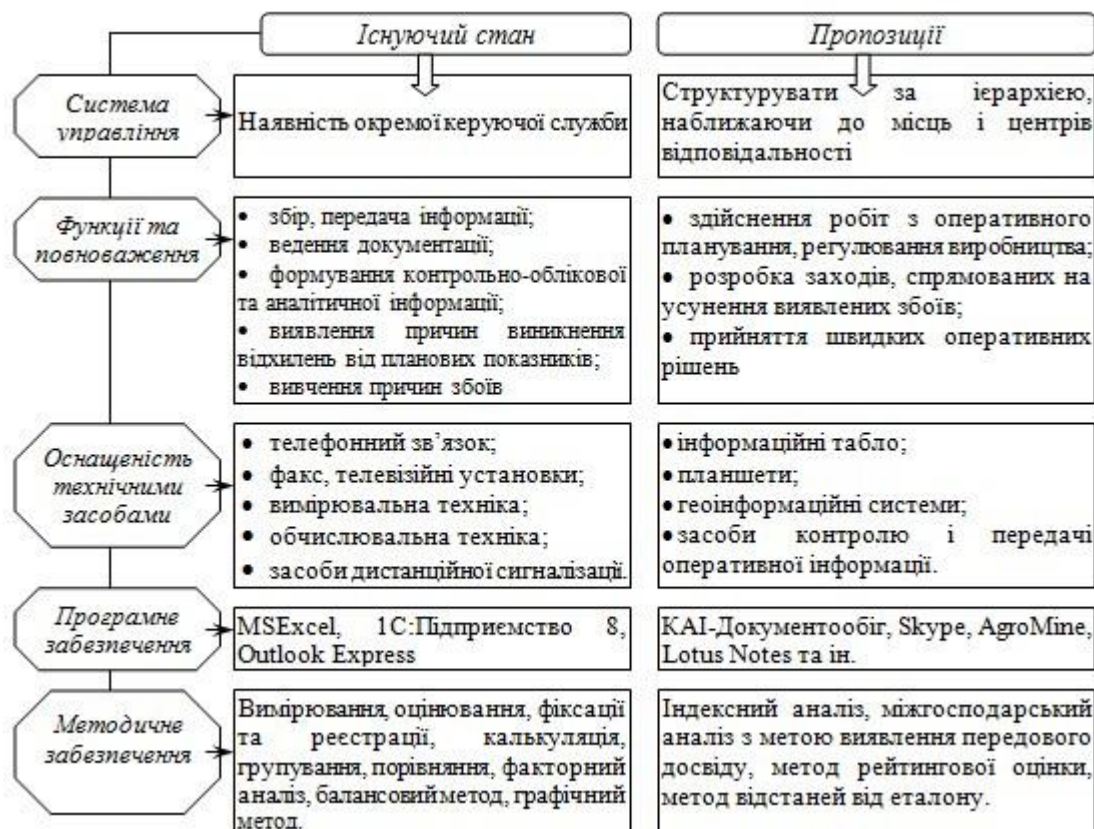
Рис. 3. Характерні риси сучасного технічно-методичного забезпечення аналізу та напрями його удосконалення на підприємствах АПК

Головний лозунг даного дослідження – не просто пояснити, в яких напрямках має проводитися організація аналізу на сільськогосподарських підприємствах, а спонукати їхніх керівників відійти від формальних розрахунків до затребуваних й актуальних аналітичних досліджень. Адже майбутній розвиток вітчизняного АПК значною мірою залежить саме від грамотного управління кожним окремим господарюючим суб'єктом.