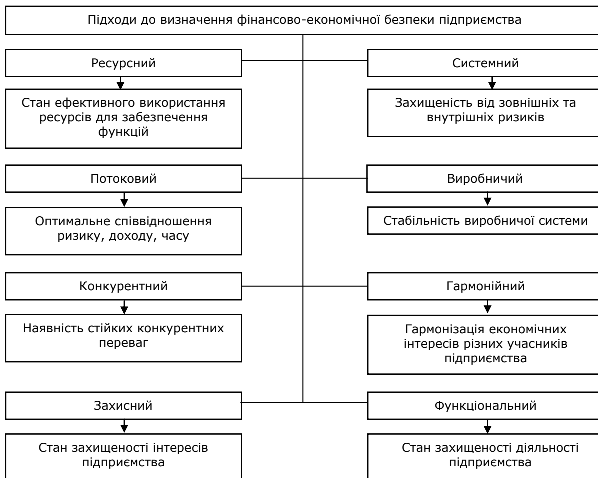
Рис. 1. Основні підходи до визначення фінансово-економічної безпеки підприємства*

Виклад основного матеріалу. На основі дослідження думок різних науковців сформовано рис. 1, який систематизує перелік та коротку суть різноманітних підходів до розуміння досліджуваного поняття.