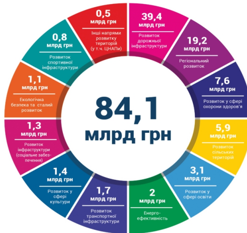
Рис 1. Державна підтримка розвитку територій в 2019 році

Поряд із цим, з 2014 року, впроваджуючи державну регіональну політику, Уряд України щороку збільшує обсяг державної фінансової підтримки розвитку регіонів та громад. Це підтверджує проведений аналіз бюджетних програм державного бюджету, який свідчить, що у 2019 році Уряд реалізовує 79 програм державної підтримки розвитку територій, на які передбачено понад 84 млрд грн (у 2018 році обсяг такої підтримки склав понад 66 млрд грн). (рис 1).