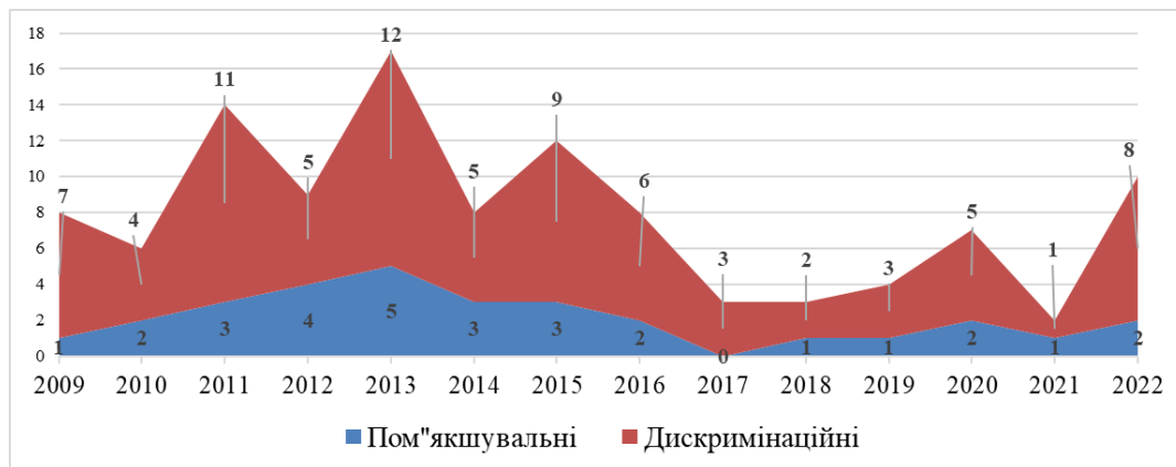
Рис. 4. Кількість обмежувальних заходів України відносно країн ЄС-28 впродовж 2009-2022 років

З рис. 4 видно, що загалом дискримінаційні заходи переважають над пом'якшувальними, проте їх кількість у десятки разів менша, аніж у країн ЄС-28 відносно України.