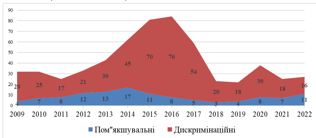
Рис. 1. Кількість обмежувальних заходів РФ відносно України впродовж 2009-2022 років*

Як спостерігаємо з рис. 1, у загальному підсумку протекціоністських заходів переважають дискримінаційні. Понад те, варто відзначити стрімку тенденцію до їх зростання з 2011 до 2016 року, що хронологічно збігається з періодом посилення політичних сутичок між РФ та Україною.